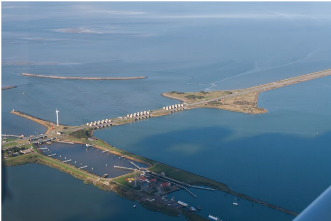
Afsluitdijk bij Den Oever.