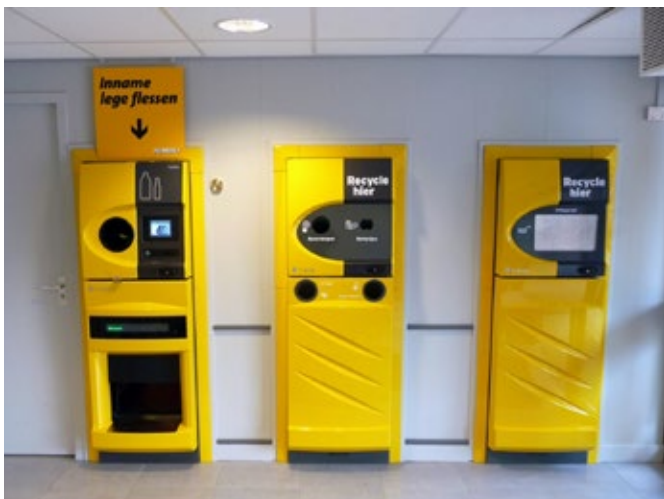
Automaten voor hergebruik van plastic, lampen, batterijen en frituurvet.

Voor ruwe grondstoffen én halffabricaten bestaat tot slot nog een andere zeer belangrijke oplossing, die door meerdere experts bepleit wordt: de opbouw van een strategische reserve - zoals die ook al bestaat voor olie en gas. Dit komt aan bod in de volgende paragraaf (2.3).