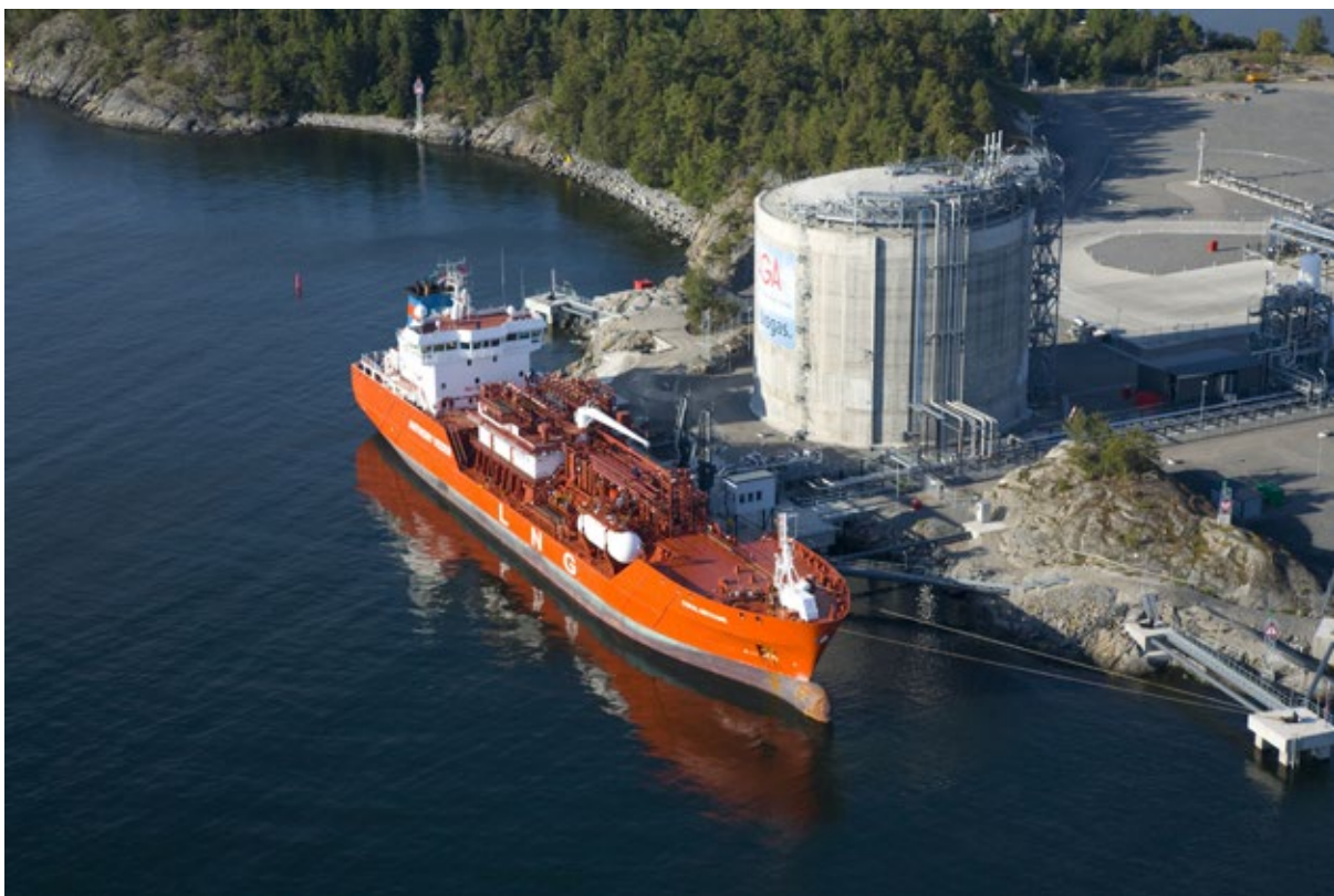
AGA LNG-terminal in Nynäshamn, Zweden.

Er zijn ook diverse punten waarop de belangen die aan de basis staan van het bestaande energiebeleid schuren met de verhoogde urgentie ten aanzien van energieveiligheid. Zo is het voor het terugdringen van de importafhankelijkheid voor olie en gas enerzijds een topprioriteit om de energietransitie te versnellen, maar maakt diezelfde gevaarlijke importafhankelijkheid het eveneens belangrijk om gericht te blijven investeren in fossiele elementen van de energievoorziening. Experts pleiten daarbij nadrukkelijk voor diversiteit en redundantie - diversiteit van aanvoerlijnen en importmogelijkheden, zoals een overcapaciteit van lng-terminals afgestemd op crisisniveau's, en redundantie idealiter voor 'alle' single points of failure én voor (regelbaar) elektriciteitsopwekkend vermogen in het bijzonder. Dat vraagt onder andere een capaciteitsmarkt - en mogelijk ook nationalisering. Daarnaast wordt een reserve-infrastructuur bepleit die uitsluitend bedoeld is om een basale energievoorziening te kunnen behouden in de hoogste noodscenario's, waaronder directe oorlog - vanuit het besef dat allerlei aanvoerlijnen van energie dan niet langer gegarandeerd zullen zijn.