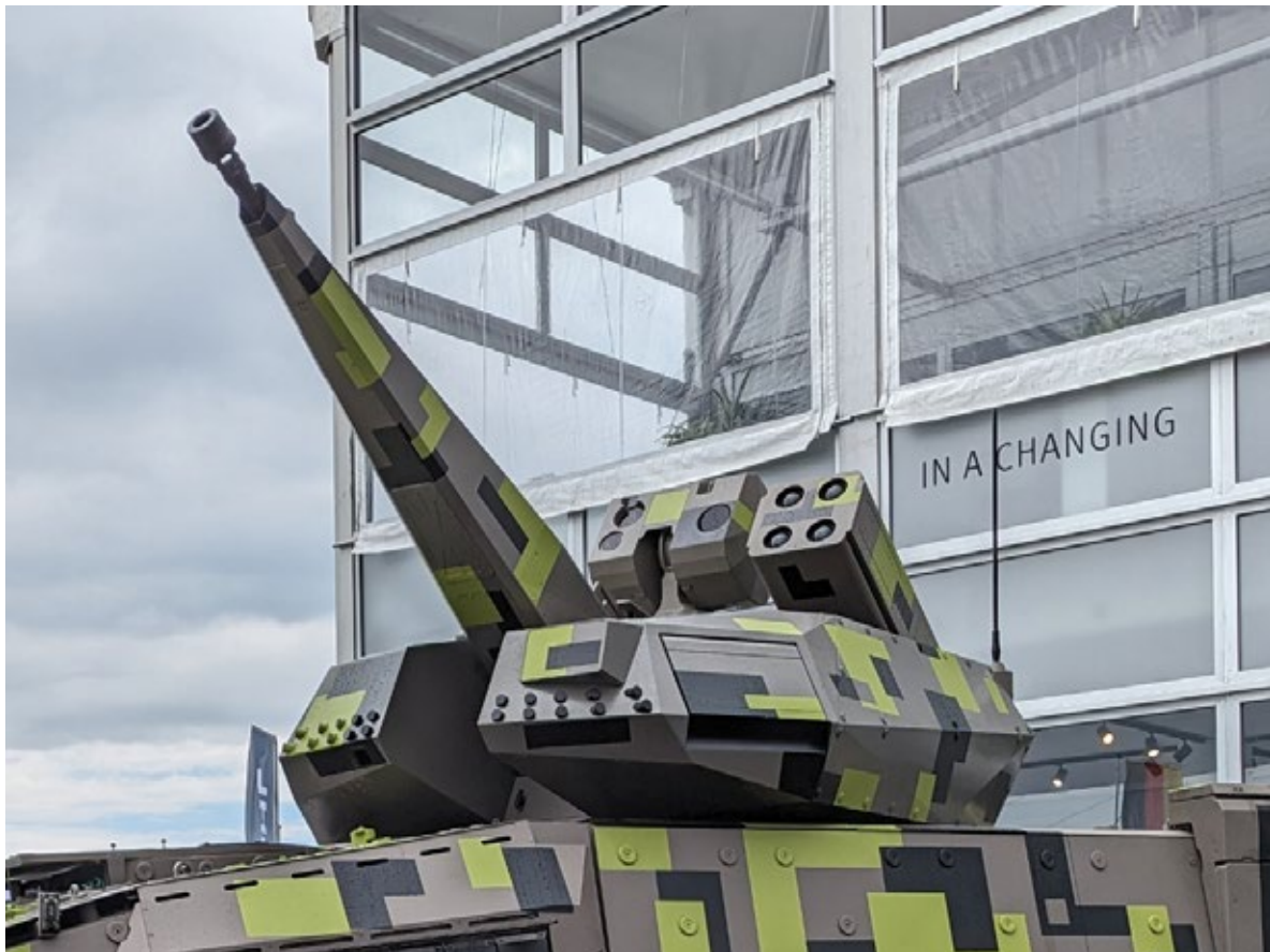
Rheinmetall BOXER Skyranger 30 luchtverdedigingssysteem.

In principe zijn bovengenoemde NASAMS- en NOMADS-systemen goed in staat dergelijke drones uit de lucht te schieten. Maar uit Oekraïne is geleerd dat je om economische redenen in massa geproduceerde goedkope drones idealiter niet wilt neerhalen met dure en beperkt beschikbare AMRAAM- of Sidewinder-luchtdoelraketten, maar bij voorkeur met systemen die gebruik maken van goedkope, maar eveneens effectieve munitie, zoals snelvuurkanonnen (een variant van de in 2013 aan Jordanië verkochte Nederlandse PRTL's blijkt in Oekraïne zeer effectief tegen drones) of EW-apparatuur om de besturing van de drones te verstoren. Defensie heeft als modern substituuat voor de PRTL onlangs de Duitse Skyranger 30 aangeschaft en investeert onder andere ook in mobiele antidroneradars.