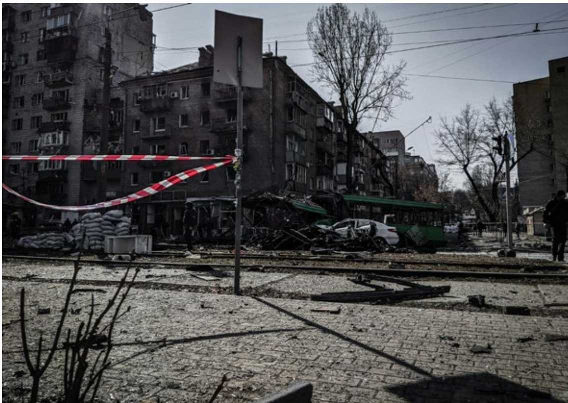
Verwoesting in Kiyy na een Russisch bombardement.

Twee jaar geleden deed de Nederlandse toenmalig voorzitter van het Militair Comité van de NAVO Rob Bauer een betekenisvolle oproep: de hele samenleving moet zich voorbereiden op het nieuwe onvoorspelbare tijdperk, met een 'samenlevingsaanpak' die voorziet in een mentaliteitsverandering bij overheden en bedrijven - en hen, naar analogie met de Finse filosofie, onderdeel maakt van een breder en effectiever defensieconcept. We gaan van een tijdperk waarin alles planbaar, voorspelbaar, controleerbaar en efficiëntiegericht was, naar een tijdperk waarin alles op elk moment kan gebeuren - een tijdperk waarin we het onverwachte moeten verwachten, aldus Bauer.