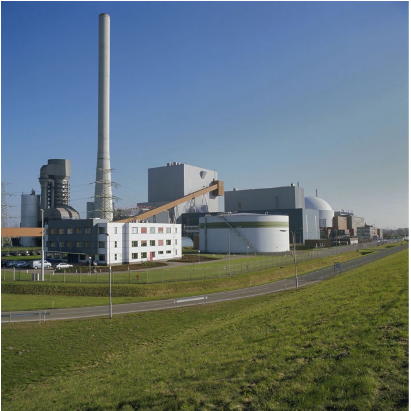
Kerncentrale in Borssele.

naar lage temperatuur-warmte te dekken. Import van waterstof kan op termijn ook een rol spelen, maar tot 2050 vermoedelijk nog beperkt. Inzet van biomassa, zowel van eigen bodem als via import, met of zonder CCS, is ook een optie, maar kent veel weerstand in de Tweede Kamer. Inzet van aardgas-met-CCS is daarnaast een mogelijkheid, maar het huidige streven in de politiek lijkt te zijn de inzet van fossiele brandstof tot een minimum - liefst tot nul - te beperken. Alles overziende, kan worden geconcludeerd dat ook het benutten van kernenergie aandacht behoeft.” - Wim Turkenburg