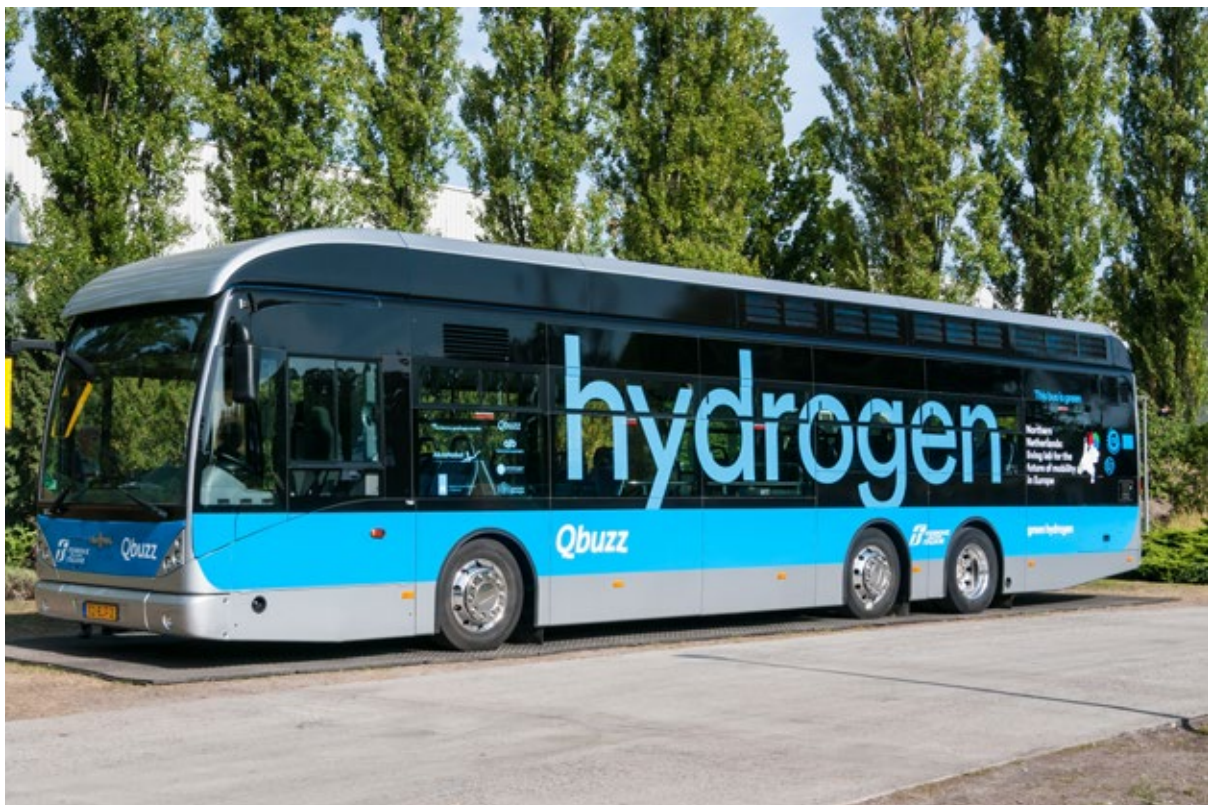
Brandstofcel bus.

In dit rapport zijn de experts verder hoofdzakelijk zelf aan het woord, met korte samenvattingen van hun (collectieve) denken, afgewisseld met een ruime collectie citaten. Uit dit geheel destilleren we 32 voornaamste aanbevelingen om de autonomie en veiligheid van onze energievoorziening zo snel mogelijk te verbeteren.