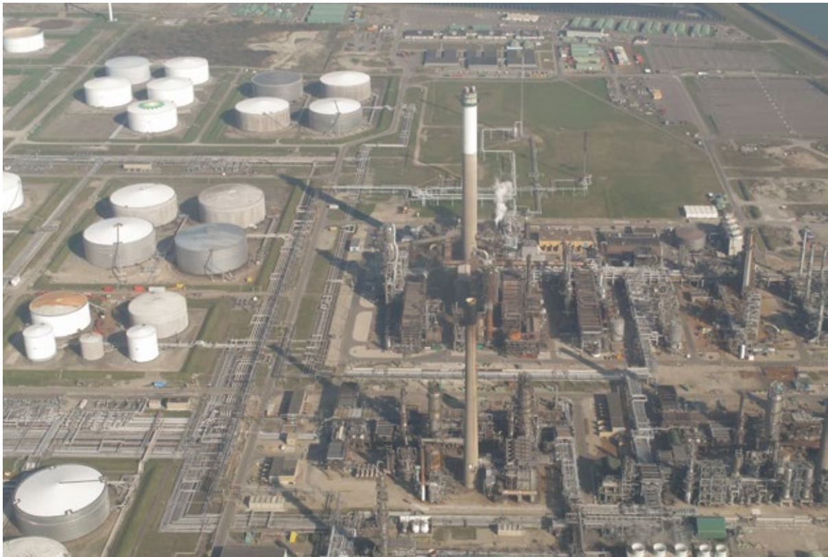
Europoort, de olieraffinaderij van BP bij de Vierde Petroleumhaven

“Wat betreft aardgas is er in Nederland en de Europese Unie een sterke beweging gemaakt weg van Russisch gas. Maar dit heeft onvoldoende geleid tot een waarlijk-ke transitie. Nederland en de Europese Unie hebben eerder de afhankelijkheid van Russisch pijpleidinggas ingeruild voor een sterke afhankelijkheid van Amerikaans lng. Door de rol van de VS als ‘provider of last resort’ zijn er nu minder alternatieven dan voorheen, mocht de aanvoer om welke reden dan ook vanuit de VS terugvallen.” - Mathieu Blondeel