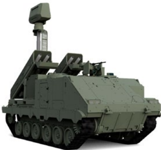
ACSV G5 NOMADS - SHORAD systeem.

Het is nogal een stap om van dit ruimtelijke niveau en dreigingsniveau terug te schakelen naar een heimelijk binnen Nederland gelanceerde vijandelijke FPV-drone - traag, klein, goedkoop, maar mogelijk voorzien van een explosieve lading die veel schade kan aanrichten aan onbeschermd infrastructuur.